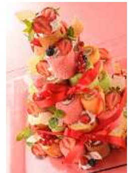
「スイーツパーティ」イメージ

スイーツがもっともふさわしい“誕生日”を始めとする“アニバーサリー（記念日）”のためのスイーツをご提案すべく、新サービス「スイーツ・フルコース」や「スイーツパーティ」を開始します。結婚記念日や還暦、米寿のお祝いなど様々な記念日を、“ハッピーフード”であるスイーツでお楽しみいただき、豊かなライフスタイルを実現します。