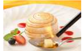
「大人スイーツ」イメージ

これまで5年間で築き上げた“スイーツの殿堂”としてのイメージはそのままだけに、さらに落ち着いたくつろぎの時間を過ごせる、上質で華麗な施設に進化し、ハッピーフードであるスイーツをお楽しみいただく、豊かなライフスタイルをご提案します。